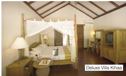
Deluxe Villa Kihaa