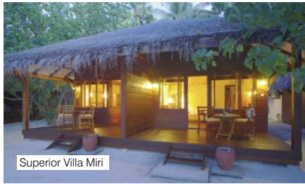
Superior Villa Miri