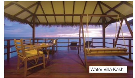
Water Villa Kashi