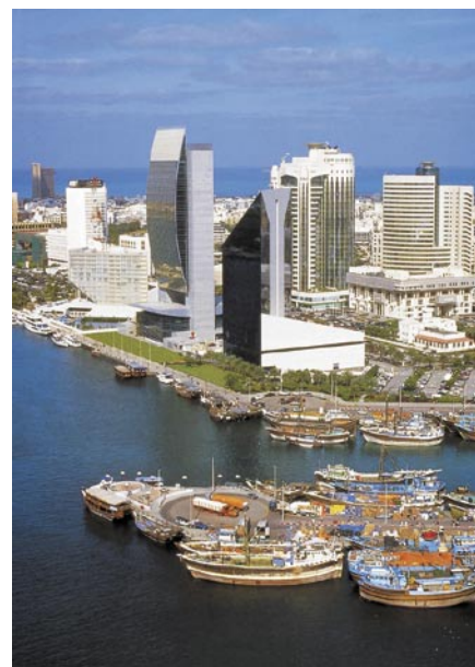
Dubai City: Creek

Nach dem Frühstück im Hotel Freizeit bis zum Flughafentransfer Dubai oder nach Abu Dhabi (Aufpreis) bzw. bis zur Weiterreise entsprechend dem gebuchten Programm. (F)