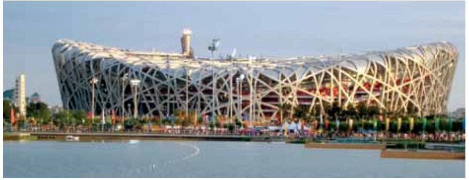
Peking: Olympiastadion „Vogelnest“ mit Olympischer Flamme 2008

wohl beliebteste Motiv chinesischer Landschaftsmalerei. Sie erleben die ganze Schönheit der Region bei einer Schiffsfahrt auf dem Li-Fluss, die Sie bis nach Yangshuo, rund 60 km südlich von Guilin, führt (Rückfahrt nach Guilin per Bus).