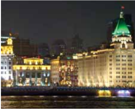
Shanghai: Blick von Pudong zum Bund („Peace Hotel“)