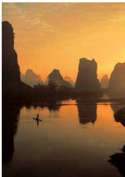
Guilin: Landschaft am Li-Fluss

■ 14. Tag: Shanghai – Suzhou – Shanghai Tagesausflug nach Suzhou: In der Blütezeit der Stadt gab es hier mehr als 150 klassische Gärten. Heute sind noch etwa 10 davon zugänglich. Sie besuchen das alte Stadtviertel um das Stadttor Panmen und sehen den „Garten des Meisters der Netze“ sowie den „Tigerhügel“ mit dem „Schwertteich“ und der „Wolkenfelspagode“. Rückfahrt nach Shanghai, wo Sie zum Abschluss des Tages Hightech bei Ihrer Fahrt mit der Magnetschwebebahn Transrapid erleben. (F/M)