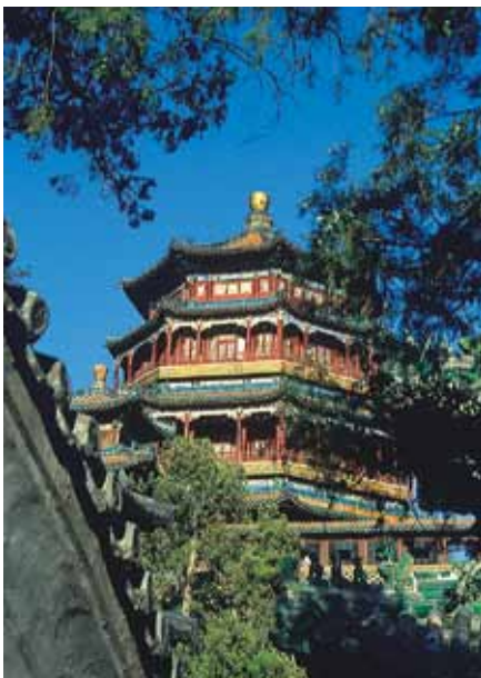
Peking: Sommerpalast Yiheyuan

■ 3. Tag: Peking Vor der Besichtigung der „Verbotenen Stadt“ bummeln Sie über einen der größten Plätze der Welt, den „Platz des Himmlichen Friedens“. 24 Kaiser der Ming- und Qing-Dynastie residierten von etwa 1420 bis 1911 in den mehr als 9.000 Räumen der „Verbotenen Stadt“, dem größten mittelalterlichen Pa-