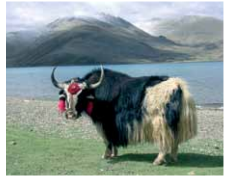
Tibet: Yak am Yamdrok-See