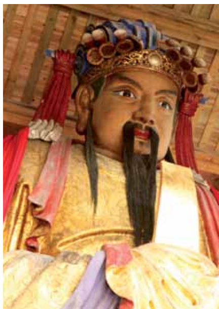
Yangzi: In der „Geisterstadt“ Fengdu

■ 9. Tag: Yangzi-Kreuzfahrt – Ankunft in Chongqing Ende des Programms mit der Ankunft in der Bergstadt Chongqing am Morgen. (F)