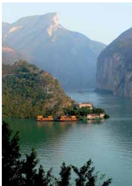
Yangzi: Blick in die Qutang-Schlucht

■ 4. Tag: Yangzi-Kreuzfahrt (Wuhan) Besuch des Museums der Provinz Hubei. Hier können Sie u. a. ein zwei Tonnen schweres und reich verziertes Glockenspiel bewundern, das vor 2.500 Jahren zusammen mit den Konkubinen dem Grab des Fürsten Yi beigegeben wurde. Ablegen zur Weiterfahrt in Richtung „Drei Schluchten“ am Nachmittag. (VP)