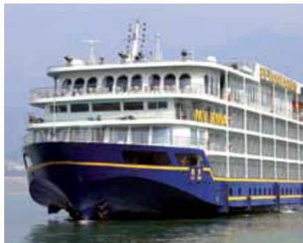
Victoria Cruises: MV Jenna