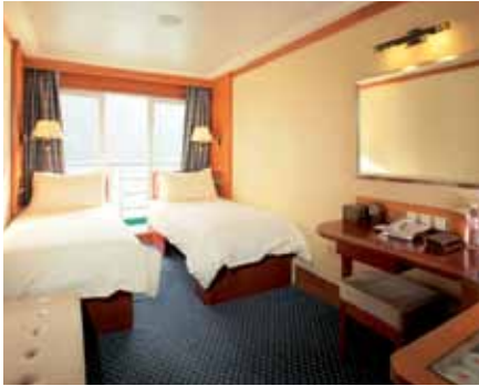
Victoria Cruises: Wohnbeispiel Superior (MV Jenna)