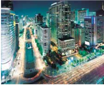
Seoul bei Nacht