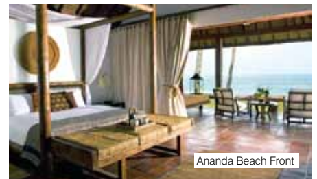
Ananda Beach Front