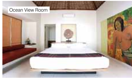
Ocean View Room