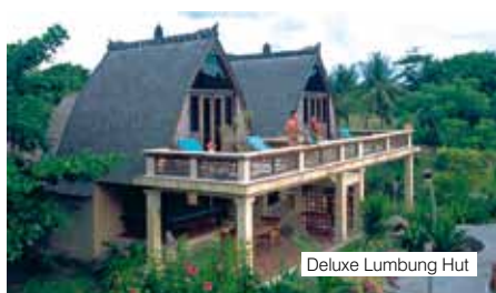
Deluxe Lumbung Hut