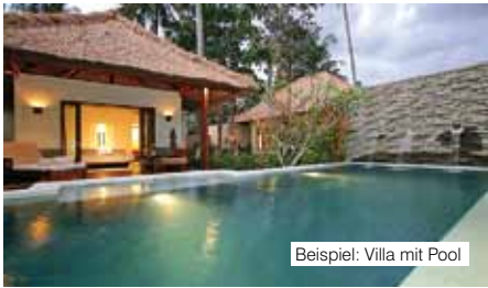
Beispiel: Villa mit Pool