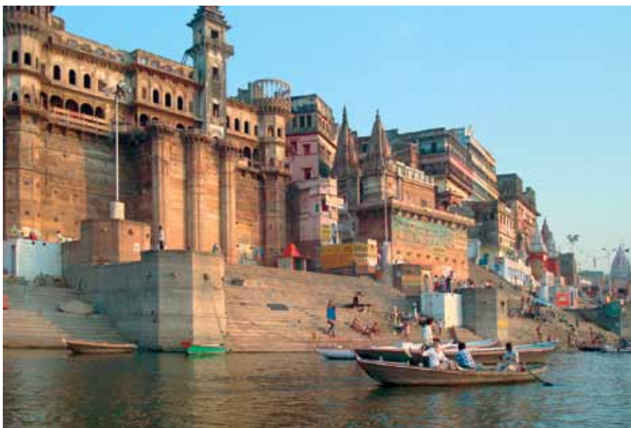
Varanasi: Ghats am Ufer des Ganges

Bei Sonnenaufgang erleben Sie während einer Bootsfahrt die heiligen Rituale der Gläubigen am Ufer des Ganges, das hier von Tempeln aus dem 18. und 19. Jahrhundert gesäumt wird. Nirgends ist die Faszination von hinduistischen Riten, lärmenden Men-