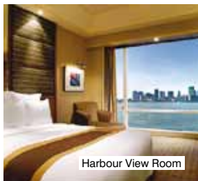
Harbour View Room