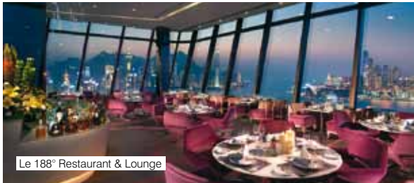
Le 188° Restaurant &amp; Lounge